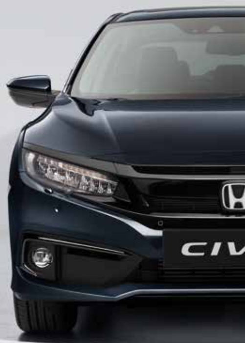
COSMIC BLUE METALLIC