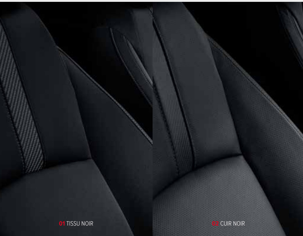
01 TISSU NOIR

Détails concernant nos cuirs : les parties centrales du dossier et de l'assise des sièges avant, les parties latérales inférieures (soutiens latéraux), la face des dossiers et de l'assise des sièges arrière sont en cuir d'origine bovine. Les parties centrale et inférieure des appuis-tête avant, l'arrière des sièges avant et les côtés des assises et des dossiers sont en simili cuir. Les côtés de la banquette, la partie inférieure périmétrique des assises et les différentes faces de l'accoudoir arrière sont également en simili cuir.