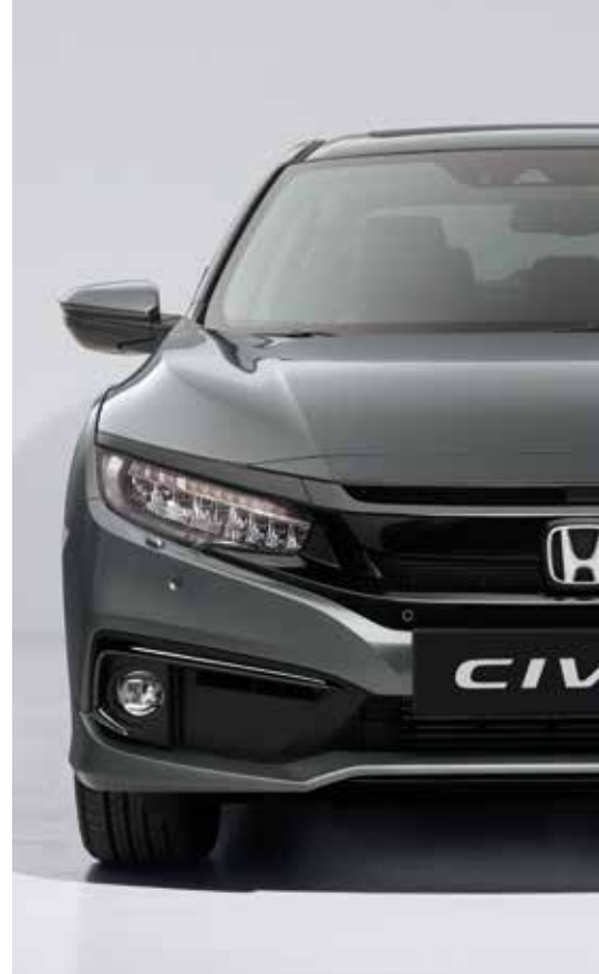
POLISHED METAL METALLIC