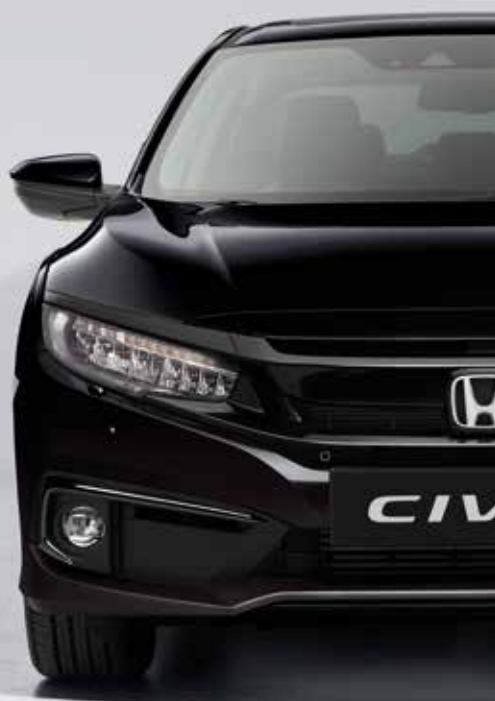
MIDNIGHT BURGUNDY PEARL