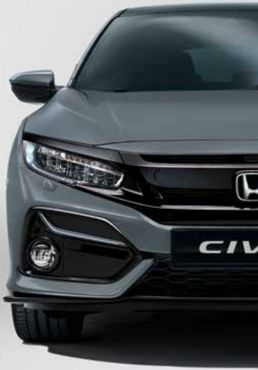
SONIC GREY PEARL