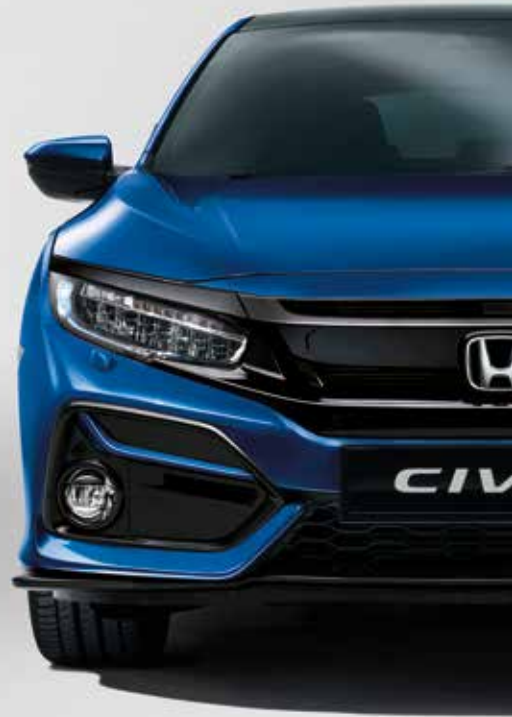
BRILLIANT SPORTY BLUE METALLIC