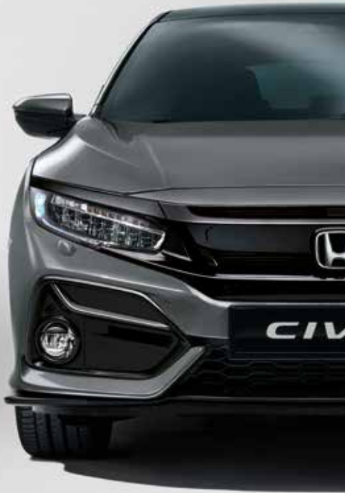
POLISHED METAL METALLIC