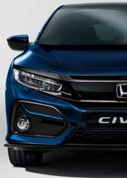
OBSIDIAN BLUE METALLIC