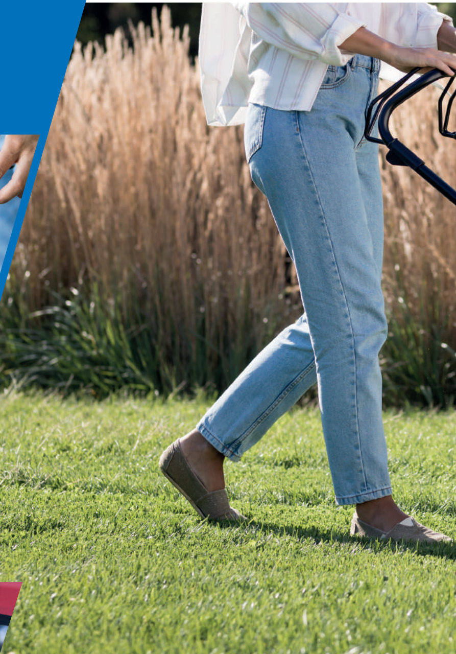
Mulching on/off Versamow™