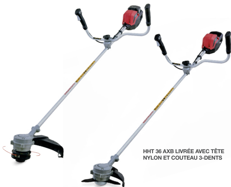
HHT 36 AXB LIVRÉE AVEC TÊTE NYLON ET COUTEAU 3-DENTS