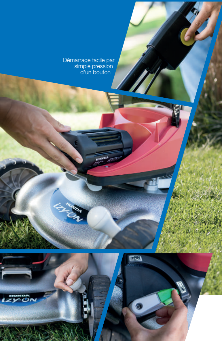
Réglage en hauteur du carter de coupe

Démarrage facile par simple pression d'un bouton