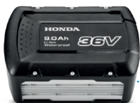
36V 9.0 Ah DPW3690XA