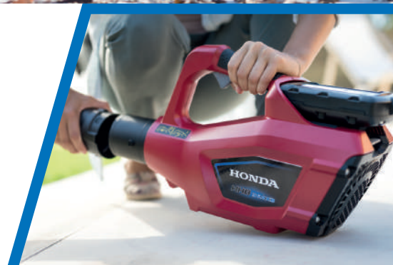
HHB 36 AXB