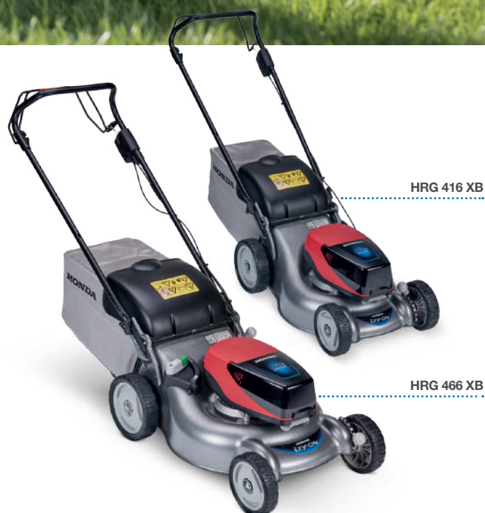
HRG 416 XB

Conçue pour éviter les obstructions, réduire l'entretien et s'adapter à tous les besoins du jardinier, elle est équipée d'un bac de ramassage à débit d'air pour optimiser le ramassage, d'un réglage de la hauteur de coupe flexible et du mulching sélectif Versamow™. Certifiée IP54 pour résister aux intempéries, elle vous permet de couper l'herbe mouillée en toute sécurité. Même la pluie ne vous arrêtera pas.