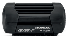
36V 4.0 Ah DP3640XA