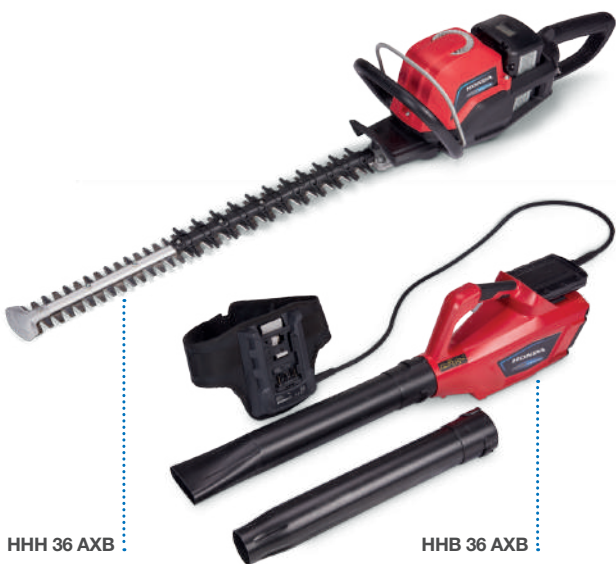
HHH 36 AXB