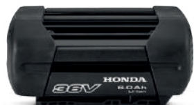
36V 6.0 Ah DP3660XA