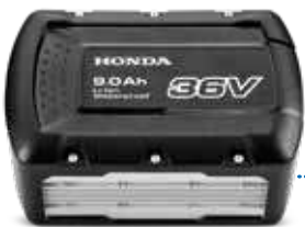
36V 9.0 Ah DPW3690XA