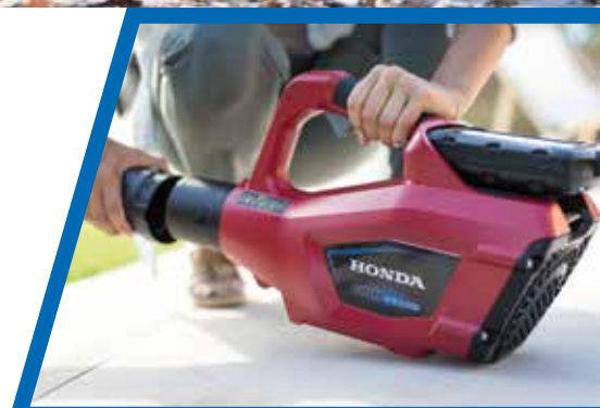
HHB 36 AXB