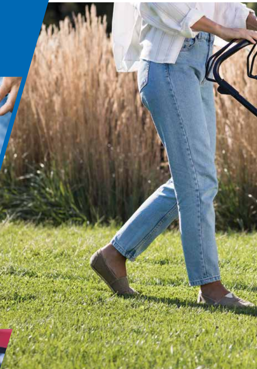
Mulching on/off Versamow™