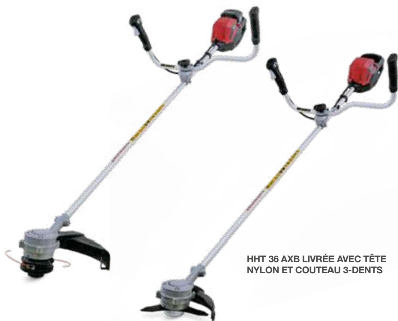
HHT 36 AXB LIVRÉE AVEC TÊTE NYLON ET COUTEAU 3-DENTS