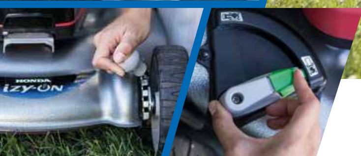
Réglage en hauteur du carter de coupe