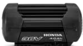
36V 4.0 Ah DP3640XA