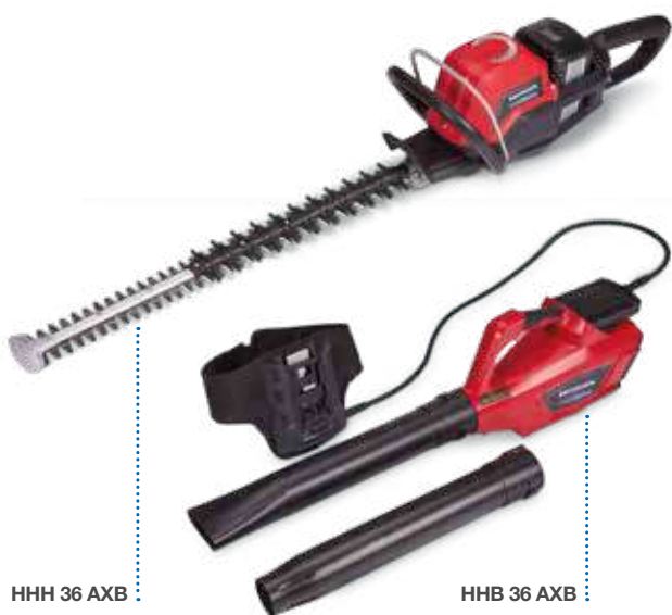
HHH 36 AXB