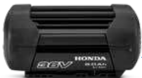
36V 6.0 Ah DP3660XA